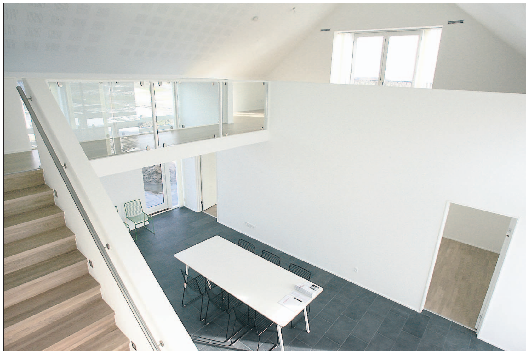
OneRoom er en åben bolig, hvor der er en flydende sammenhæng ikke blot mellem husets rum, men også mellem de to etager.