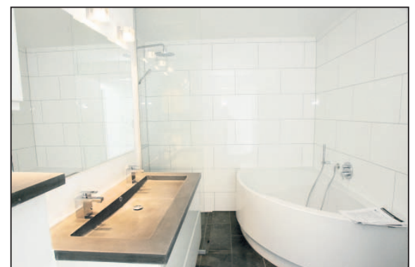
Et enkelt og stilrent badeværelse.