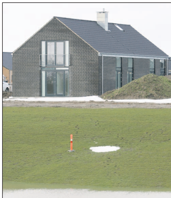
Arkitekt Bjarne Frost betegner huset set udefra som klassisk - »en form for urtypehus - en slags længehus«. Som det ses er beklædningen tegl, men man kunne også vælge træ.